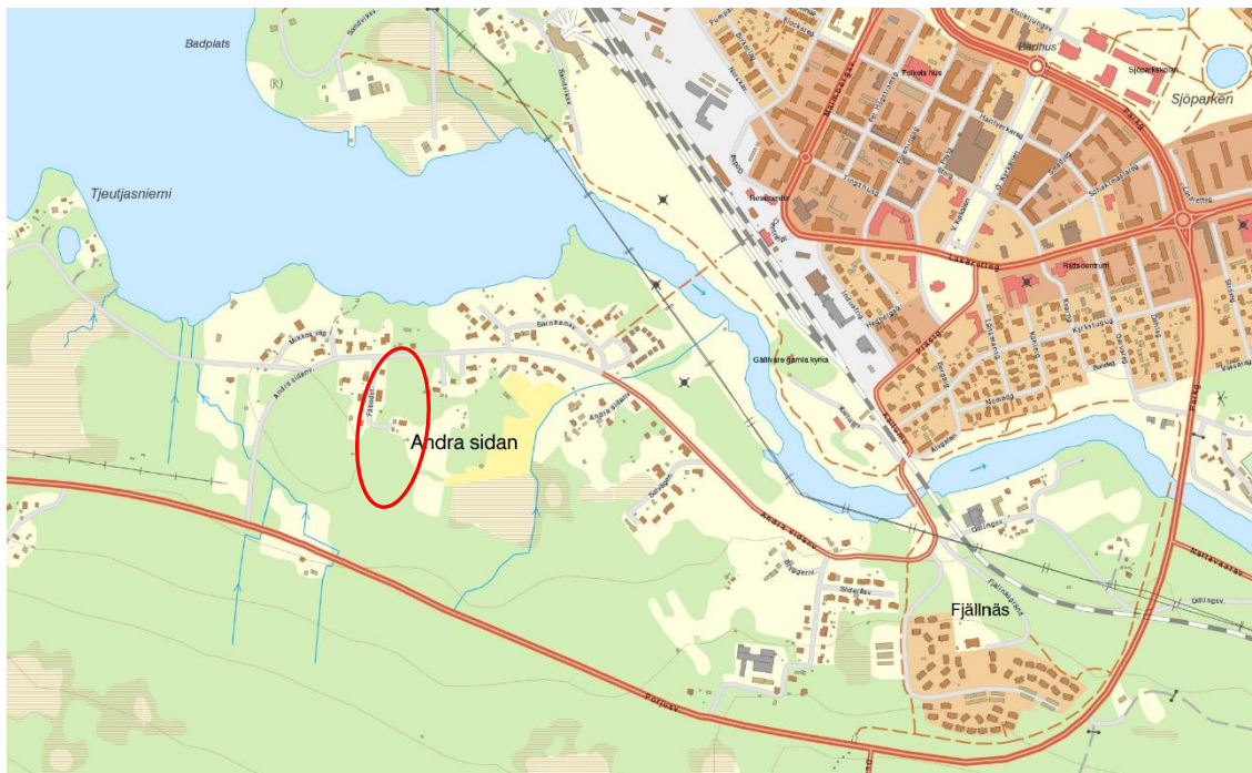
Figur 1. Översiktskarta över planområdet, som är inringat med rött.

Planområdet är beläget på Andra Sidan, söder om Vassaraträsket (se figur 1). Vägavståndet till Gällivare centrum uppgår till ca 2 km.